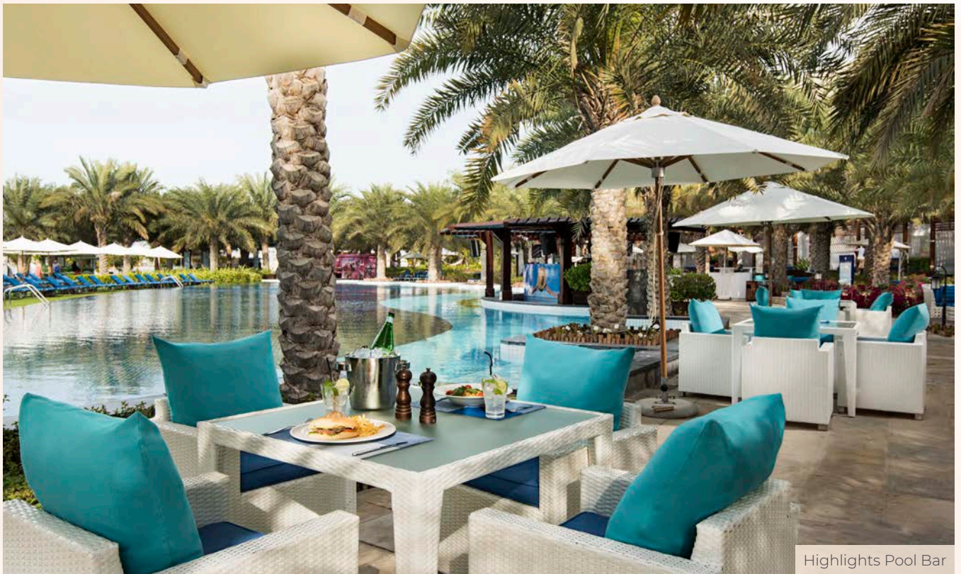
Highlights Pool Bar