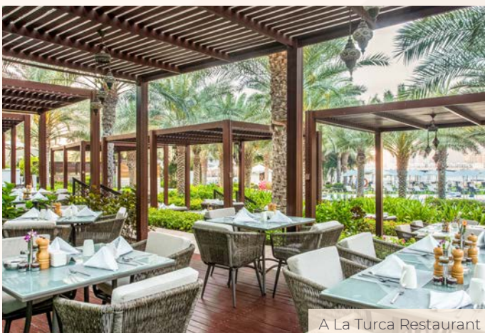
A La Turca Restaurant