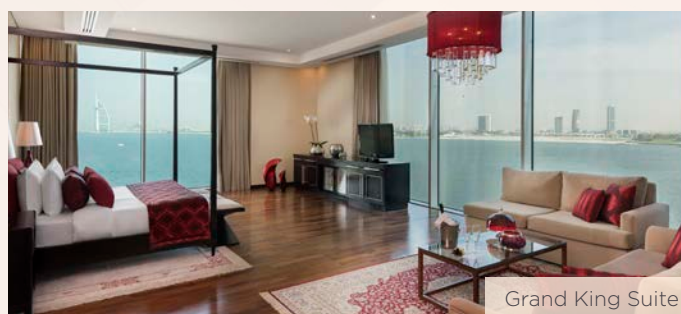
Grand King Suite